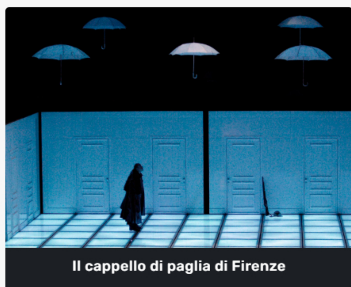
Il cappello di paglia di Firenze