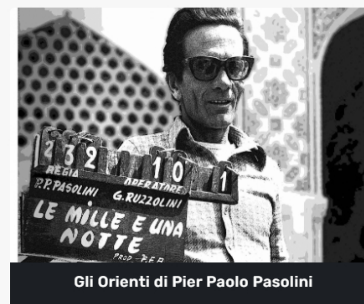
Gli Orienti di Pier Paolo Pasolini