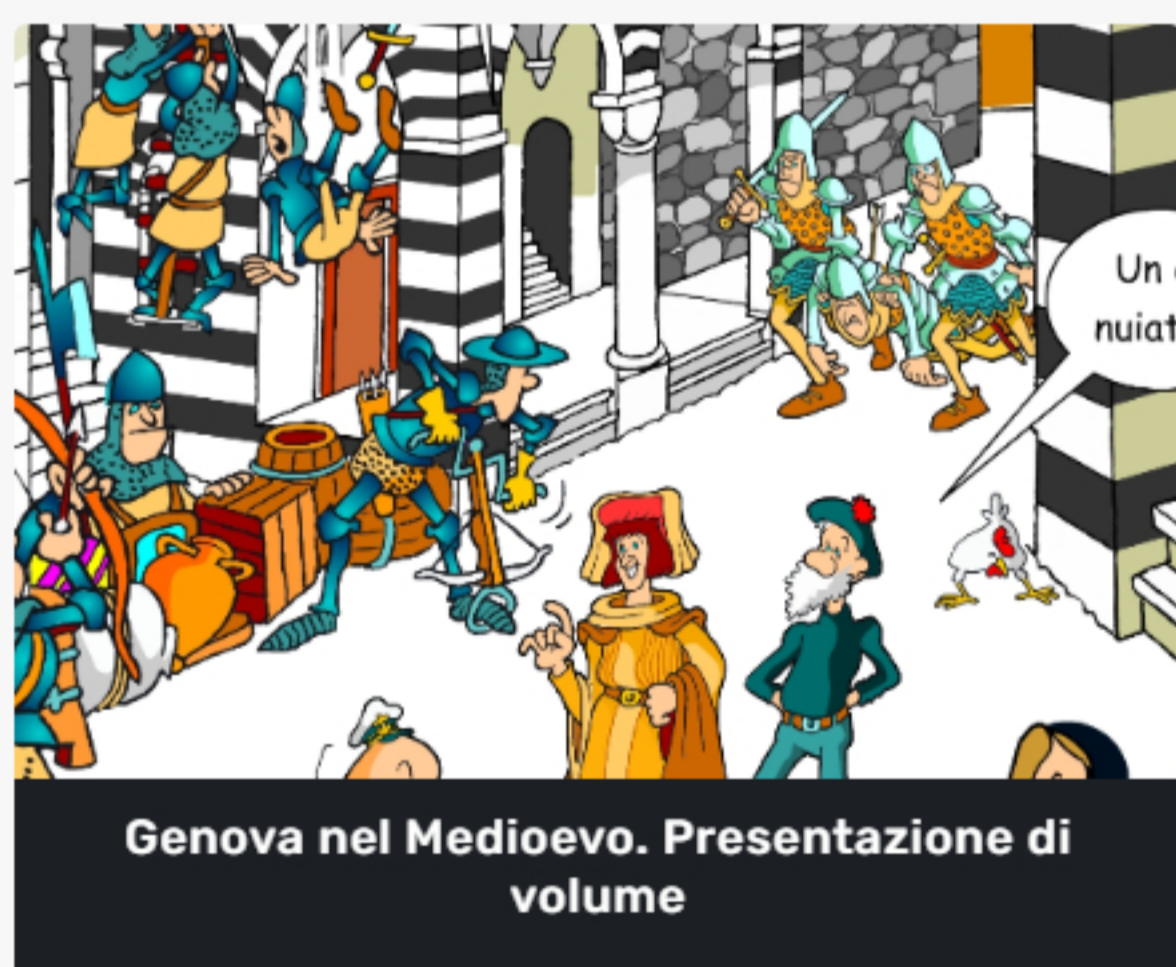
Genova nel Medioevo. Presentazione di volume