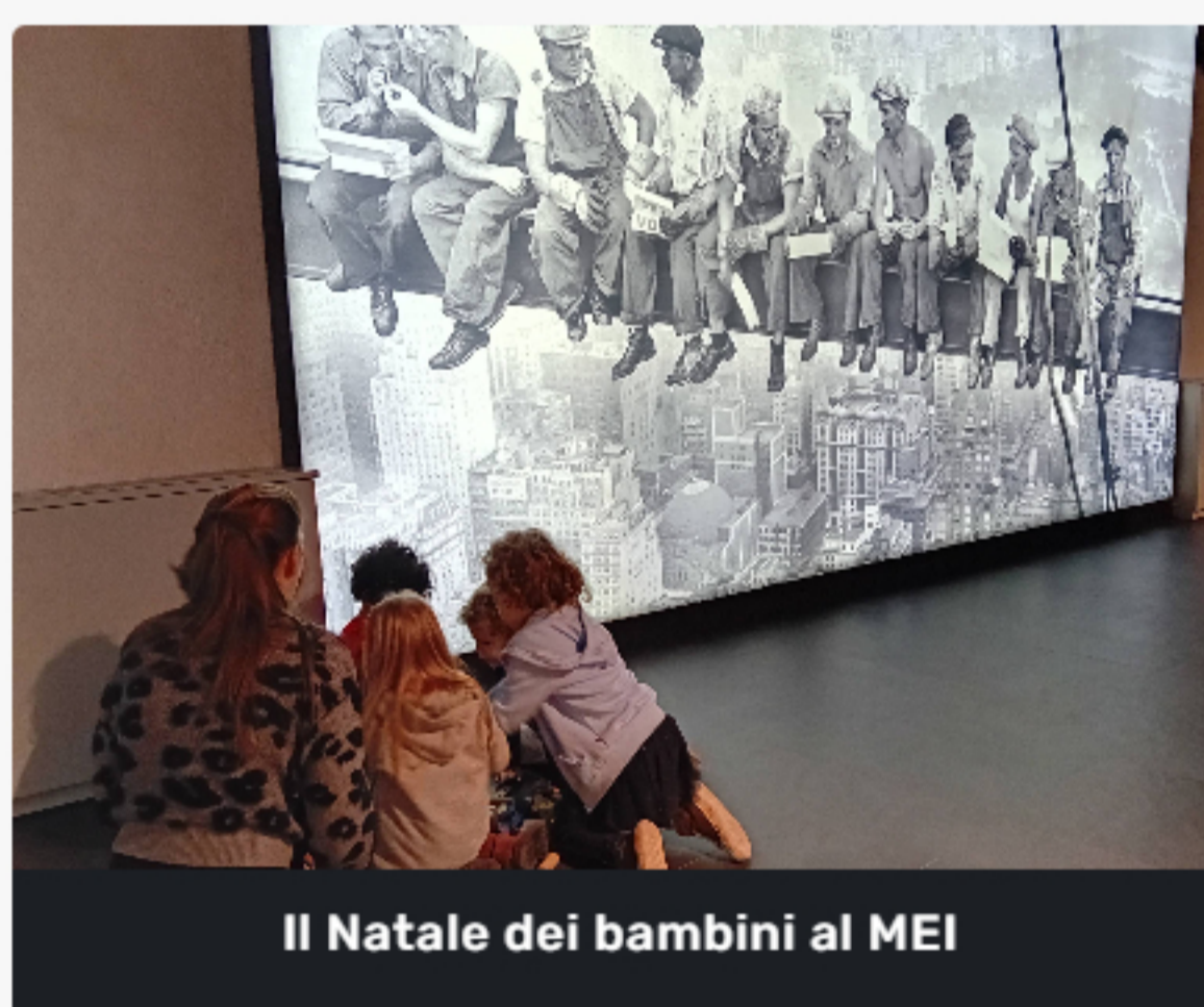
Il Natale dei bambini al MEI